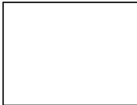
TITULAR 2 - FIRMAR DENTRO DEL CUADRO.